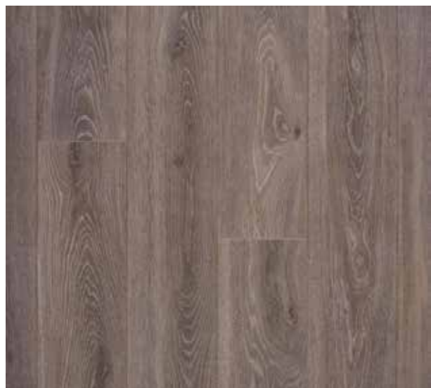
COLORIS BLOOM DARK BROWN