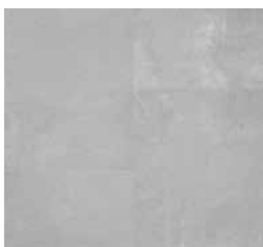
URBAN STONE LIGHT GREY