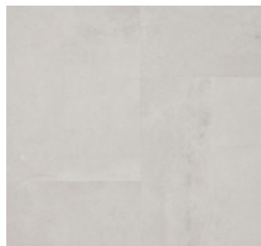
URBAN STONE LIGHT GREIGE