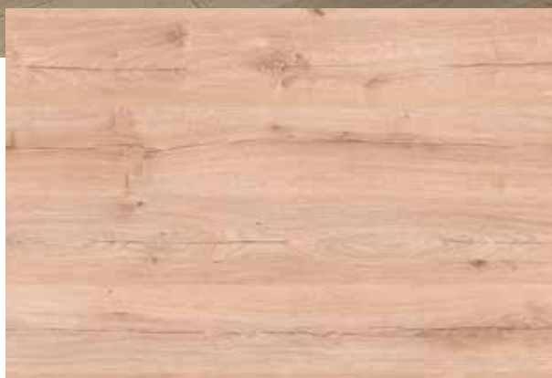
COLORIS CANYON NATURAL