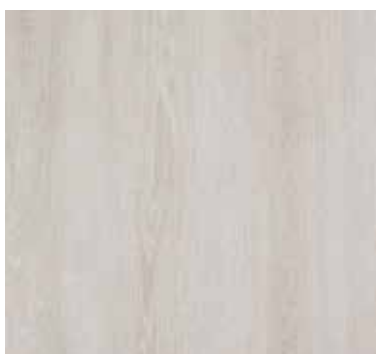
VI TOULON 109S