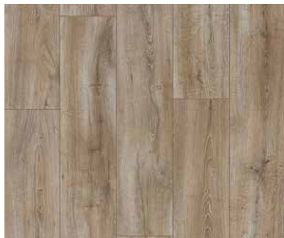
COLORIS FIJI GROOVY