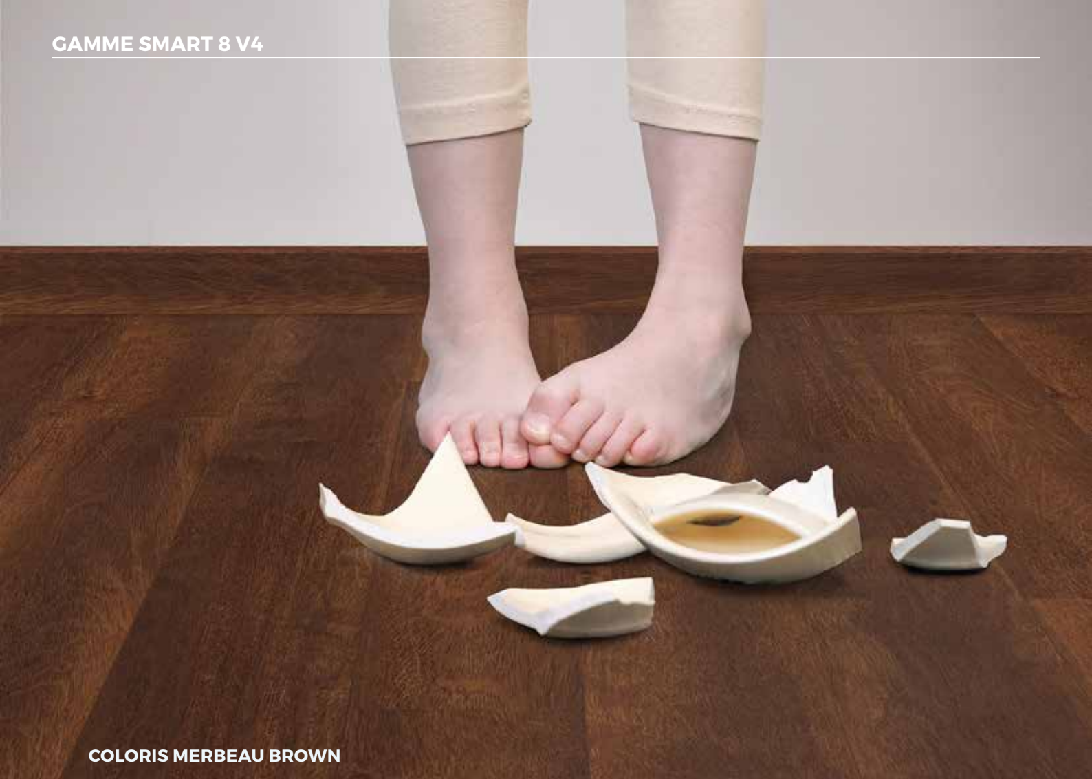
COLORIS MERBEAU BROWN