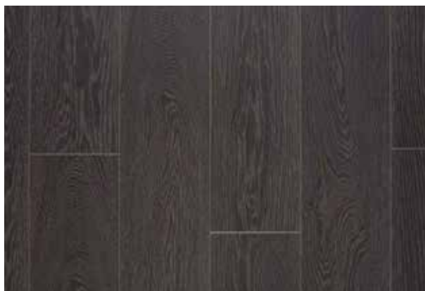
CHARME DARK GREY