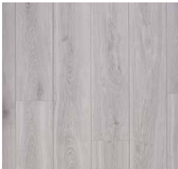
COLORIS BLOOM LIGHT GREY