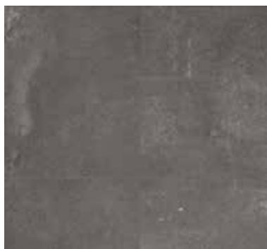
URBAN STONE DARK GREY