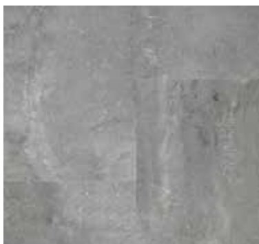
URBAN STONE GREY