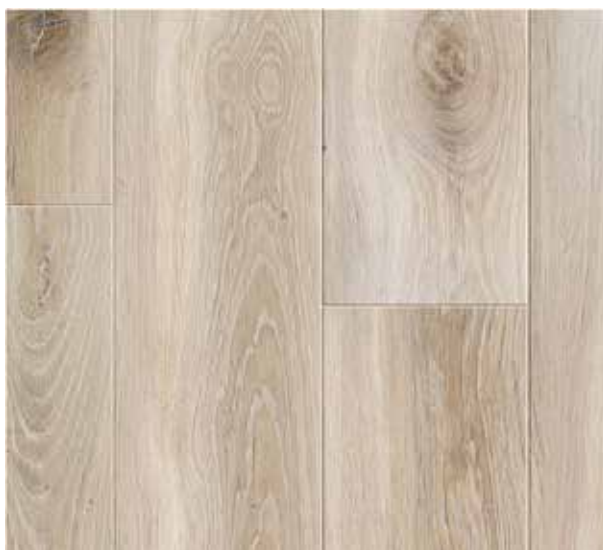
COLORIS BLOOM LIGHT NATURAL