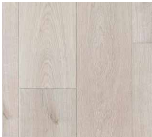
COLORIS CRUSH LIGHT